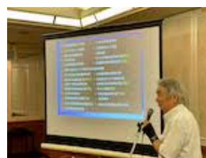
講師とL畑山にお土産