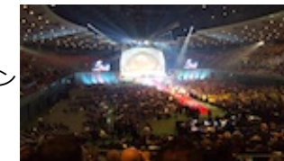
オセアルフォーラム広島開会式