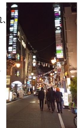
拡大できないのが残念(；_；)