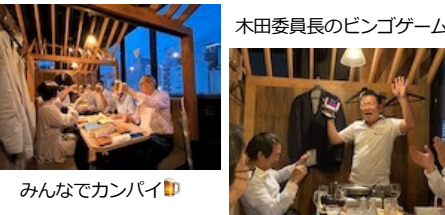
みんなでカンバイ

第1292回例会 開催日 2022年9月1日 開催場所 夜景ダイニングX肉バル 三宮テラス ●納涼例会 (移動例会) ビンゴゲーム 出席率 10名 M/U 3名 65.0% ドネーション 0円 ファイ 0円 合計 0円