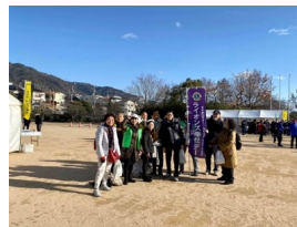
集合場所は王子陸上競技場