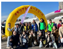
参加者でゴール前で記念撮影