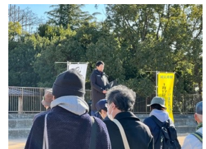
斎藤元彦兵庫県知事のスタート宣言